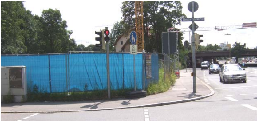
Theodor-Storm /Pippinger Str. Richtung Süden