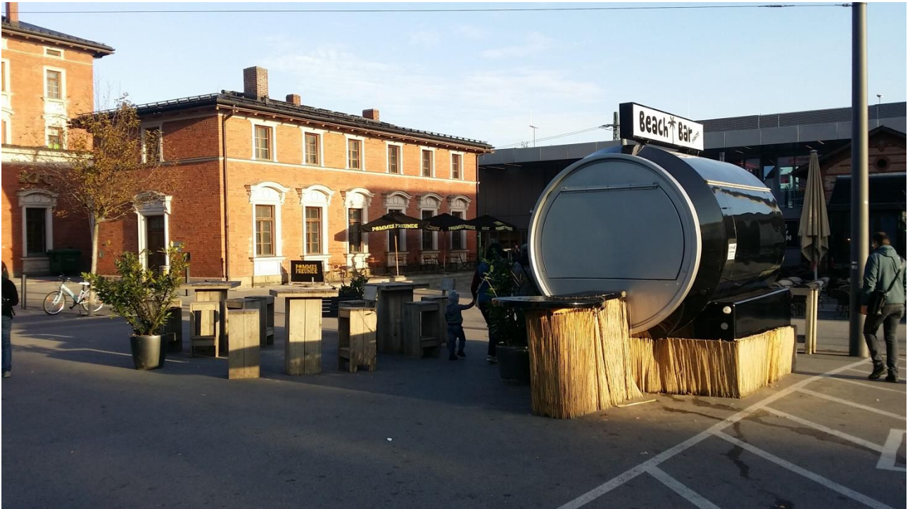
Abbildung: Beach Bar mit Tischen und Stühlen, Blick in Richtung Norden

Der BA hat sich bereits im vergangenen Jahr kritisch gegenüber dieser temporären Beach Bar geäußert. Die Bar wurde aufgrund der Kritik an der Einschränkung der Durchfahrt für RadfahrerInnen nach Osten verlegt. Die temporäre Nutzung wird auch in diesem Jahr wieder aufgenommen und stellt weiterhin ein Ärgernis dar, da die Verkehrsfläche wieder stark eingeschränkt und die Zufahrt zum Wolkentunnel nur beengt möglich ist.