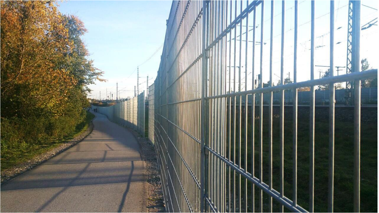
Abbildung 2: Zaun am Fahrrad- und Fußweg nördlich der Bärmannterführung von Richtung Norden