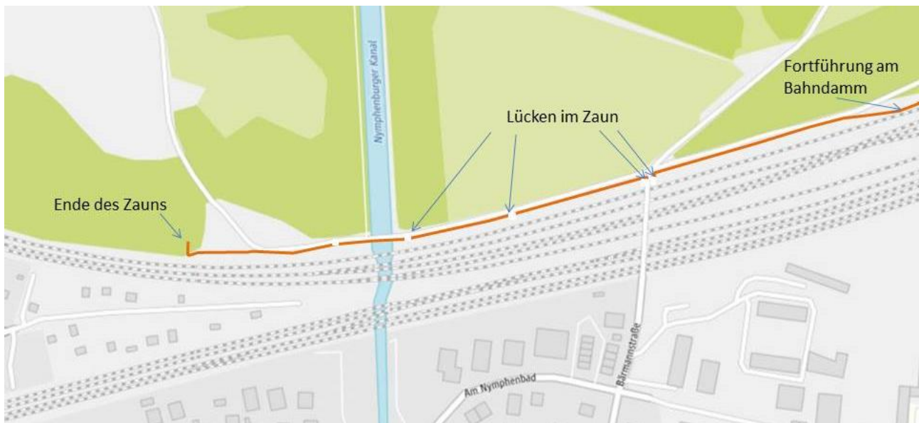
Abbildung 1: Zaubverlauf am Fuß- und Radweg im Bereich Bärmannunterführung

Seit dem 25.9.2017 wurde direkt neben dem Rad- und Fußweges in der Grünanlage am Nymphenburger Schlosspark parallel zur Bahnstrecke nördlich und südlich der Unterführung Bärmannstraße ein ca. 2 m hoher Zaun auf einer Länge von ca. 500 m aufgestellt. Diese Verschandelung der Landschaft ist nicht hinzunehmen.