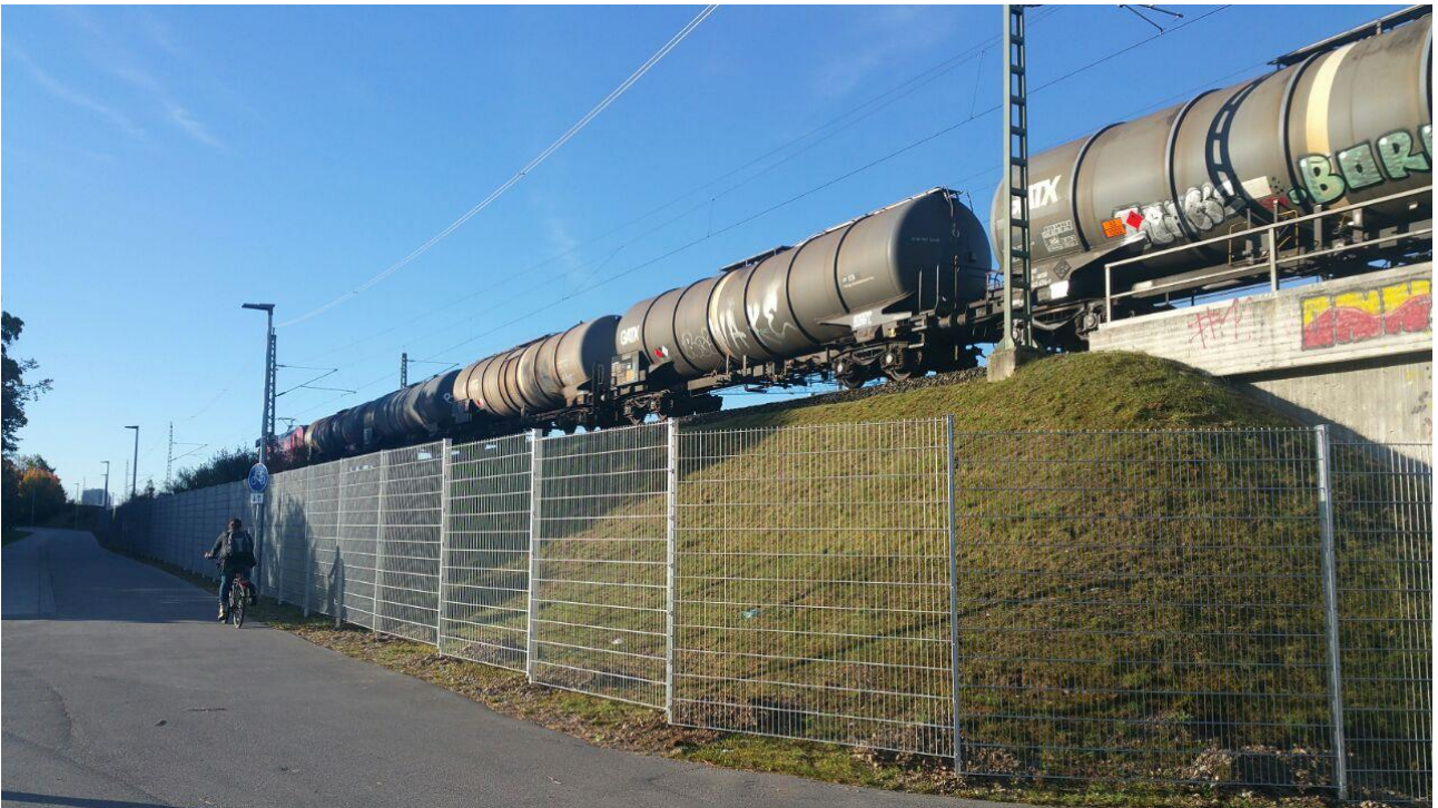
Abbildung 3: Zaun am Fahrrad- und Fußweg südlich der Bärmannterführung Richtung Süden

Der Zaun verhindert nördlich der Bärmannterführung keineswegs vollkommen das Betreten des Bahndamms, da dieser ca. 300 m oberhalb des Nymphenburger Kanals endet und damit zu umgehen ist. Außerdem sind zahlreiche Unterbrechungen im Zaun.